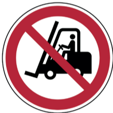
Heftrucks verboden ISO CODE: P006