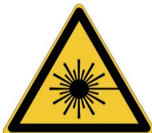
Laserstralen ISO CODE: W004