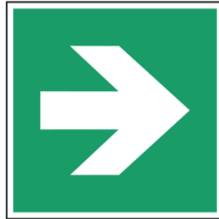
Richtingaanwijzer rechts ISO CODE: A090