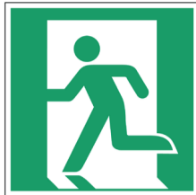
Nooduitgang links ISO CODE: E001

Het reddingsteken geeft de uitgang, nooduitgang, de weg naar een hulp- of reddingspost aan. Het is vierkant of rechthoekig van vorm. De officiële kleur is groen met wit als contrastkleur en als symboolkleur. Deze veiligheidspictogrammen zijn belangrijk omdat ze de hulpverlening of evacuatie bij een ongeval of noodsituatie versnellen en vergemakkelijken.