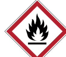
Ontvlambaar ISO CODE: GHS02