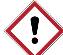
Toxisch ISO CODE: GHS07