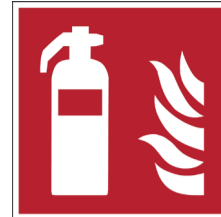
Brandblusapparaat ISO CODE: F001

Als werkgever moet je de juiste maatregelen treffen om brand te voorkomen of doeltreffend te bestrijden . Pictogrammen voor brandbestrijding, zijn steeds vierkant. De kleurencombinatie is een rode achtergrond met een wit symbool dat het brandbestrijdingsmateriaal voorstelt en de bijhorende tekst in wit.