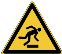
Struikelgevaar ISO CODE: W007