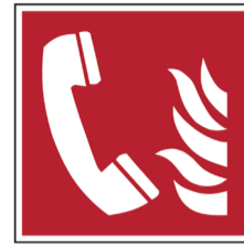
Telefoon voor brandalarm ISO CODE: F006