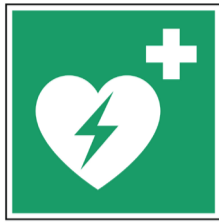
AED ISO CODE: E010