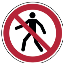
Verboden voor voetgangers ISO code: P004