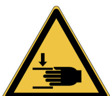
Verwondingen aan de hand ISO CODE: W024