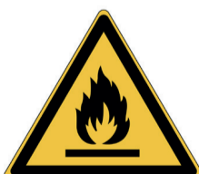
Ontvlambare stoffen ISO CODE: W021