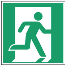
Nooduitgang rechts ISO CODE: E002