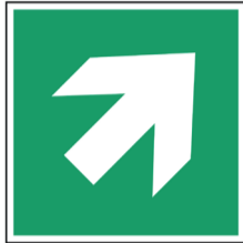
Richtingaanwijzer rechts boven ISO CODE: A045

Bovenstaande pictogrammen bestellen? Scan de QR code of ga naar: https://www.vdp.com/NL/signalisatie/pictogrammen/redding- evacuatie