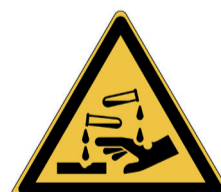
Bijtende stoffen ISO CODE: W023