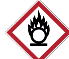
Oxiderend ISO CODE: GHS03