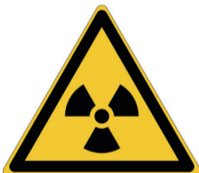
Radioactieve stoffen ISO CODE: W003