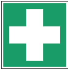
Eerste hulp ISO CODE: E003