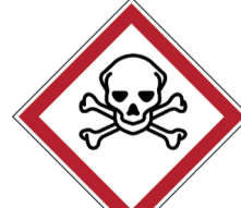
Acuut toxisch ISO CODE: GHS06