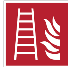
Brandladder ISO code: F003