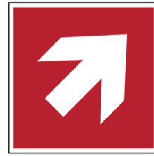
Richtingaanwijzer rechts boven rood ISO CODE: A045R

Bovenstaande pictogrammen bestellen? Scan de QR code of ga naar: https://www.vdp.com/NL/signalisatie/pictogrammen/brandbestrijding