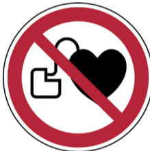
Verboden voor personen met een pacemaker ISO CODE: P007