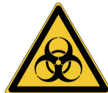
Biologisch besmettingsgevaar ISO CODE: W009