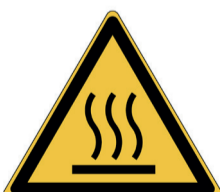
Warm oppervlak ISO CODE: W017