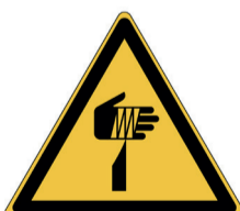
Gevaar voor scherpe elementen ISO CODE: W022