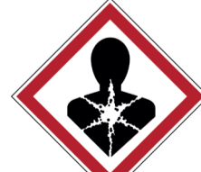
Schadelijk aan de gezondheid ISO CODE: GHS08