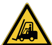
Transportvoertuigen ISO code: W014