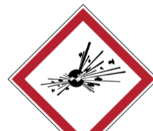
Explosiegevaar ISO CODE: GHS01

Gevaarlijke stoffen vormen een grote bron van risico's. Door juiste pictogrammen aan te brengen op bijvoorbeeld verpakkingen, kan je gevaarlijke stoffen meteen identificeren en ongevallen of beroepsziekten vermijden.