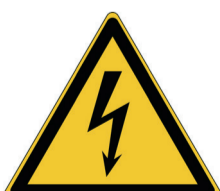
Gevaarlijke elektrische spanning ISO CODE: W012