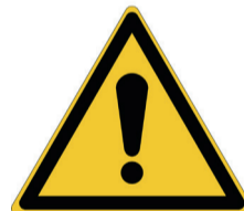
Waarschuwing ISO code: W001

Voor algemene gevaren zijn bepaalde symbolen vastgelegd in de wetgeving. Gevaren waarvoor geen speciale symbolen bestaan, worden aangeduid met het algemene gevarensymbool. Om de veiligheid van jouw medewerkers zo goed mogelijk te garanderen, kan je best een beroep doen op aanvullende waarschuwingstekens . Zo kan je het mogelijke gevaar veel concreter aangeven.