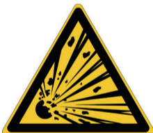
Explosieve stoffen ISO CODE: W002