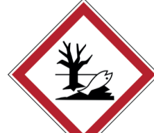
Gevaarlijk voor het milieu ISO CODE: GHS09