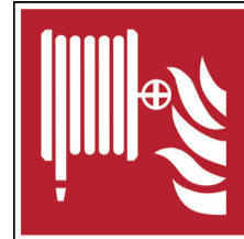
Blusslang ISO CODE: F002