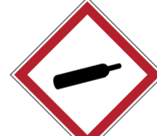
Gassen onder druk ISO CODE: GHS04