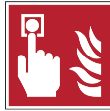
Brandmelder ISO CODE: F005