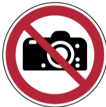
Fotograferen verboden ISO CODE: P029

Bovenstaande pictogrammen bestellen? Scan de QR code of ga naar: https://www.vdp.com/NL/signalisatie/pictogrammen/verbod