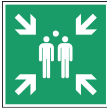
Verzamelpaats evacuatie ISO CODE: E007