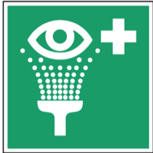
Oogdouche ISO code: E011