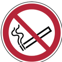
Roken verboden ISO CODE: P002

Het verbodsteken geeft aan wat je niet mag doen waardoor gevaar zou kunnen ontstaan. Het is cirkelvormig en heeft een rode rand met een rode dwarsstreep . In het zwart is het symbool dat het verbod beter omschrijft. Deze pictogrammen moeten geplaatst worden waar de gevaarlijke toestand begint.