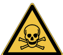
Giftige stoffen ISO CODE: W016