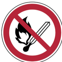
Vuur, open vlam en roken verboden ISO CODE: P003