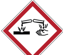
Bijtende stoffen ISO CODE: GHS05